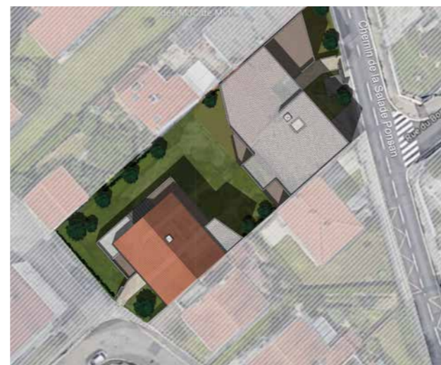
151 chemin de la Salade Ponsan

Au cœur du quartier et à deux pas d'un groupe scolaire, découvrez une résidence confidentielle, authentique et raffinée de 19 appartements modernes répartis en 2 îlots de 11 et 8 appartements. Les deux bâtiments à taille humaine et aux accents contemporains accueillent des appartements de 2 à 5 pièces prolongés par de jolis espaces extérieurs, dont des jardins privés.